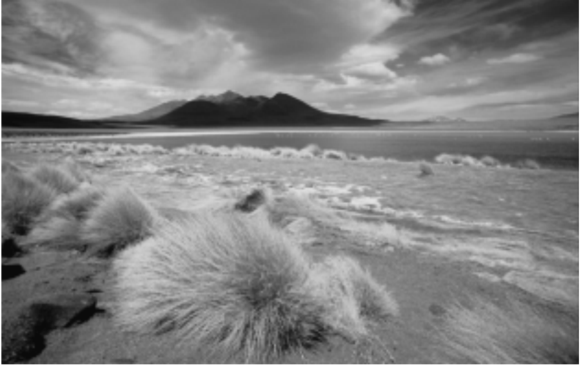
Laguna Canipa