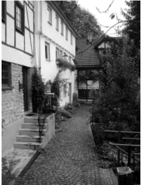
Stiller Winkel Autor: H. Neuhauser