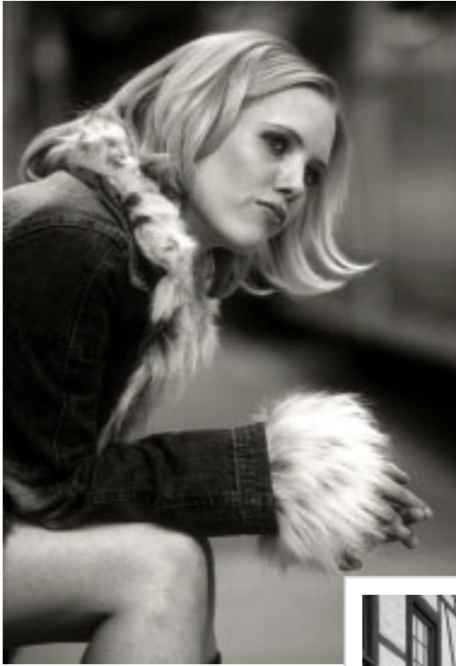
ohne Titel Autor: Michael Aupke