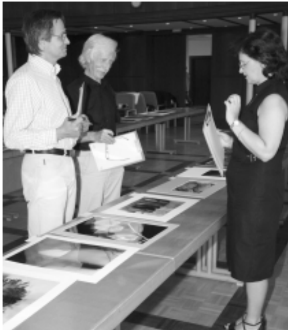
Das Jurorenteam

Alle Bilder, die Annahmen, Urkunden und Medaillen erhal-