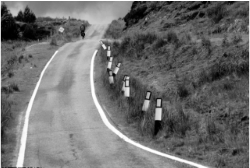
Auf schottischen Straßen Autor: Joachim Dettmer